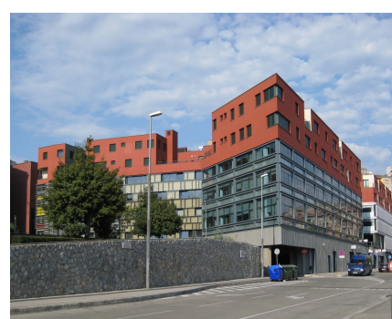
Centar Zagrad u Rijeci