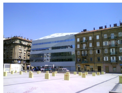
Zgrada u Agatićevoj ulici