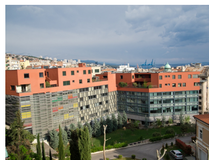
Centar Zagrad u Rijeci